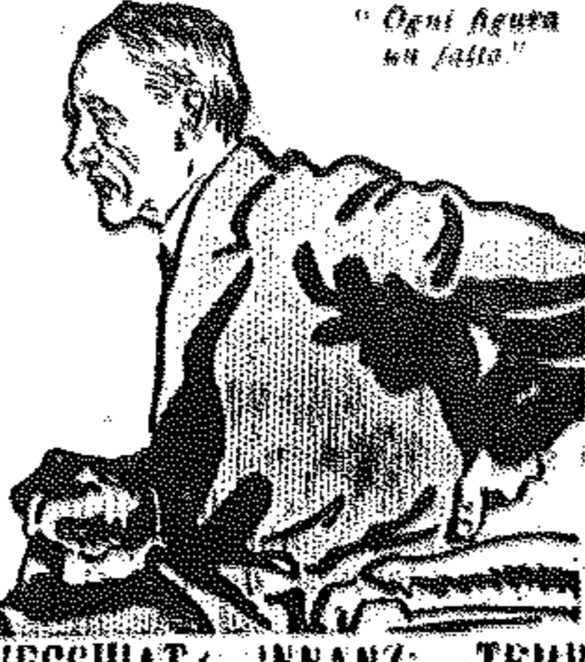
"Ogni figura ha fatto"

Oggi l'Italia riprende con Sidney Sonnino la via maestra segretata dalle sue tradizioni e dal nostro maggior Statista e l'aver rinnovato insieme al compimento dell'Unità italiana la questione del Mediterraneo e dell'influenza politica e commerciale nostra nel vicino Oriente sarà titolo perenne di onore del Ministro nazionale.