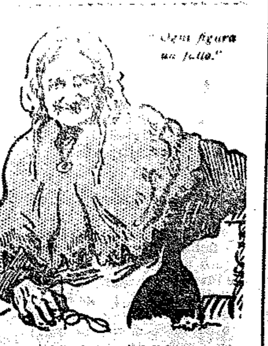
Prendete della dose regolari di buon senso