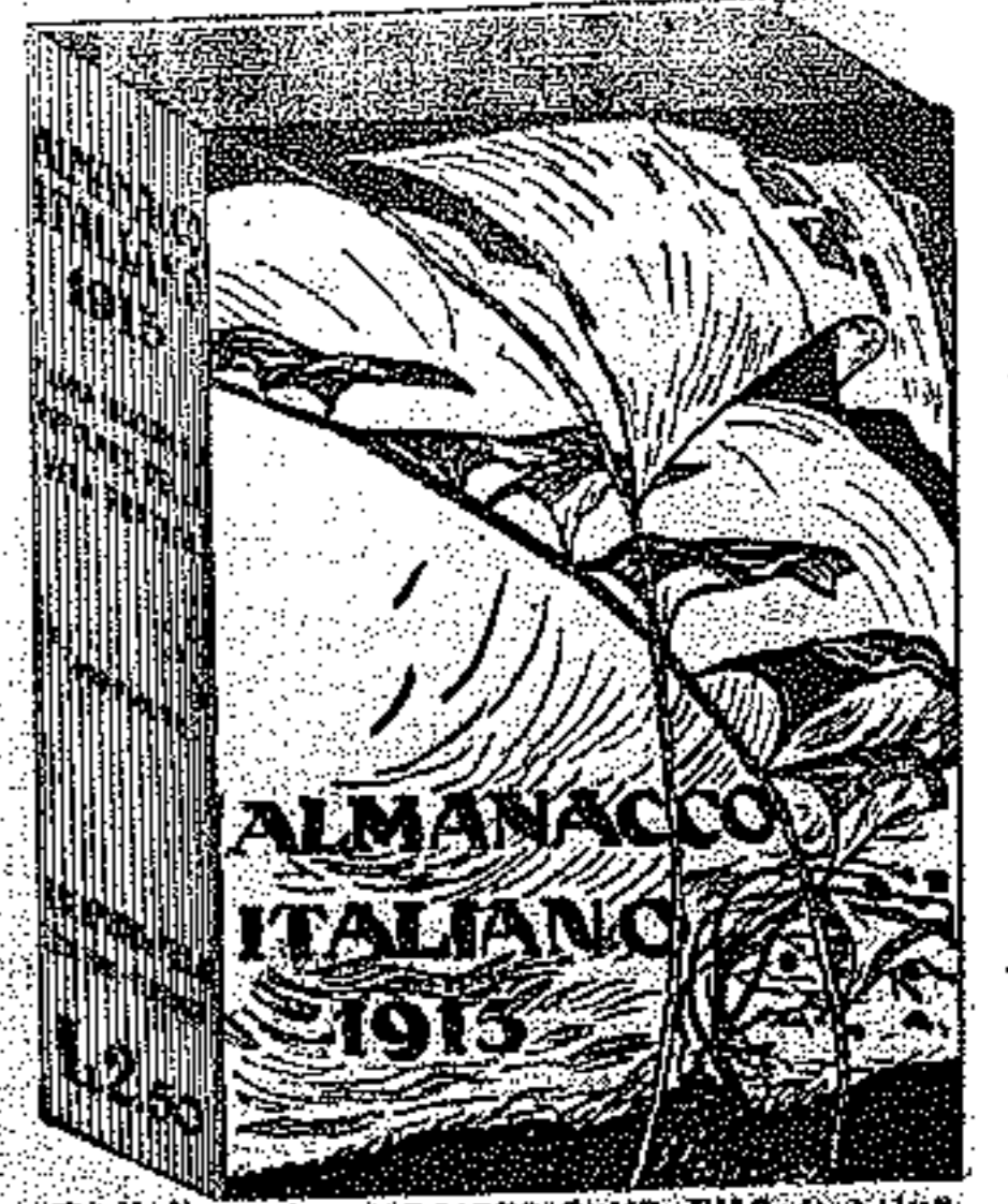
Enciclopedico popolare opera di studio, e annuario diplomatico, amministrativo, statistico. Grosso volume di 1000 figure

Gli abbonati de "La Patria", e del Figurino dei bambini e de La Moda Pratique, riceveranno un grande quadro a colori riprodotto in fotoincisione acquerellata (formato 50 x 50 cm.) uno dei capolavori più geniali del grande pittore Achille Beltrame: Il Meriggio d'estate in Liguria.