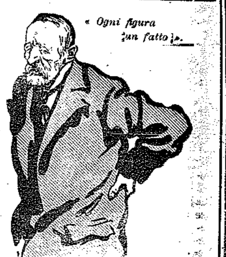
Ogni figura un fatto.