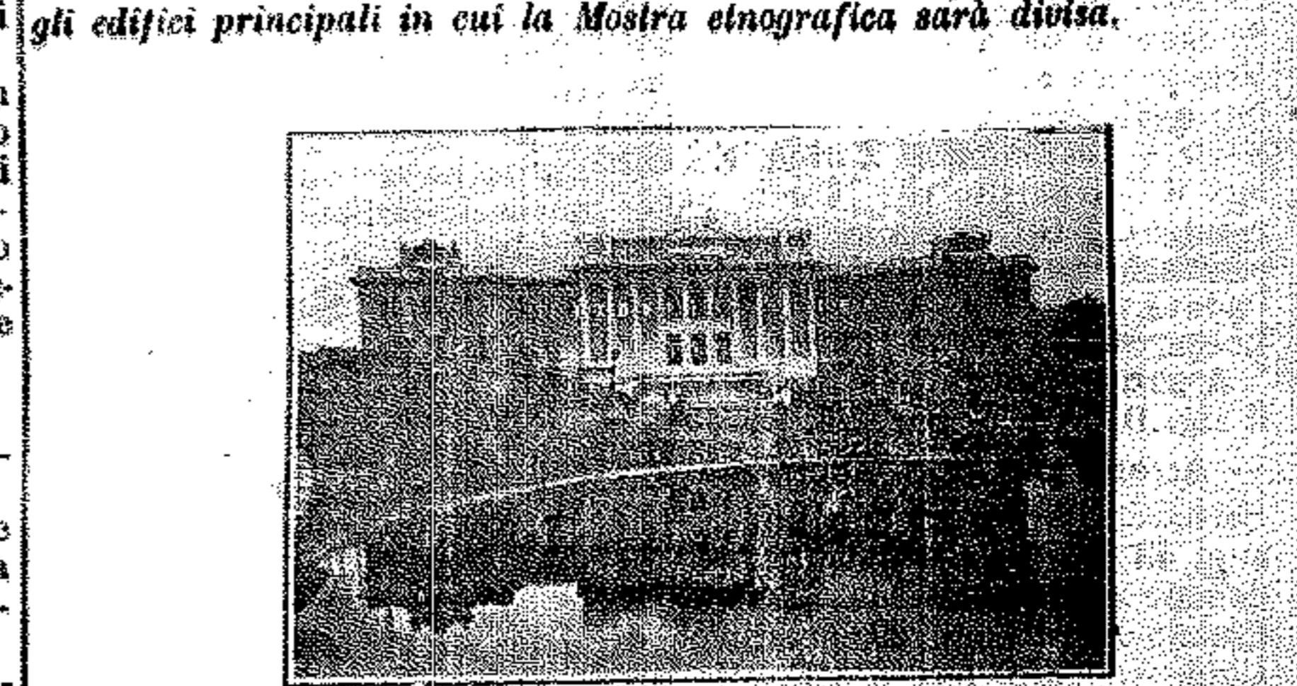
Palazzo delle raccolte etnografiche.

Diamo oggi alcune vignette che ci riproducono quali saranno per essere gli edifici principali in cui la Mostra etnografica sarà divisa.