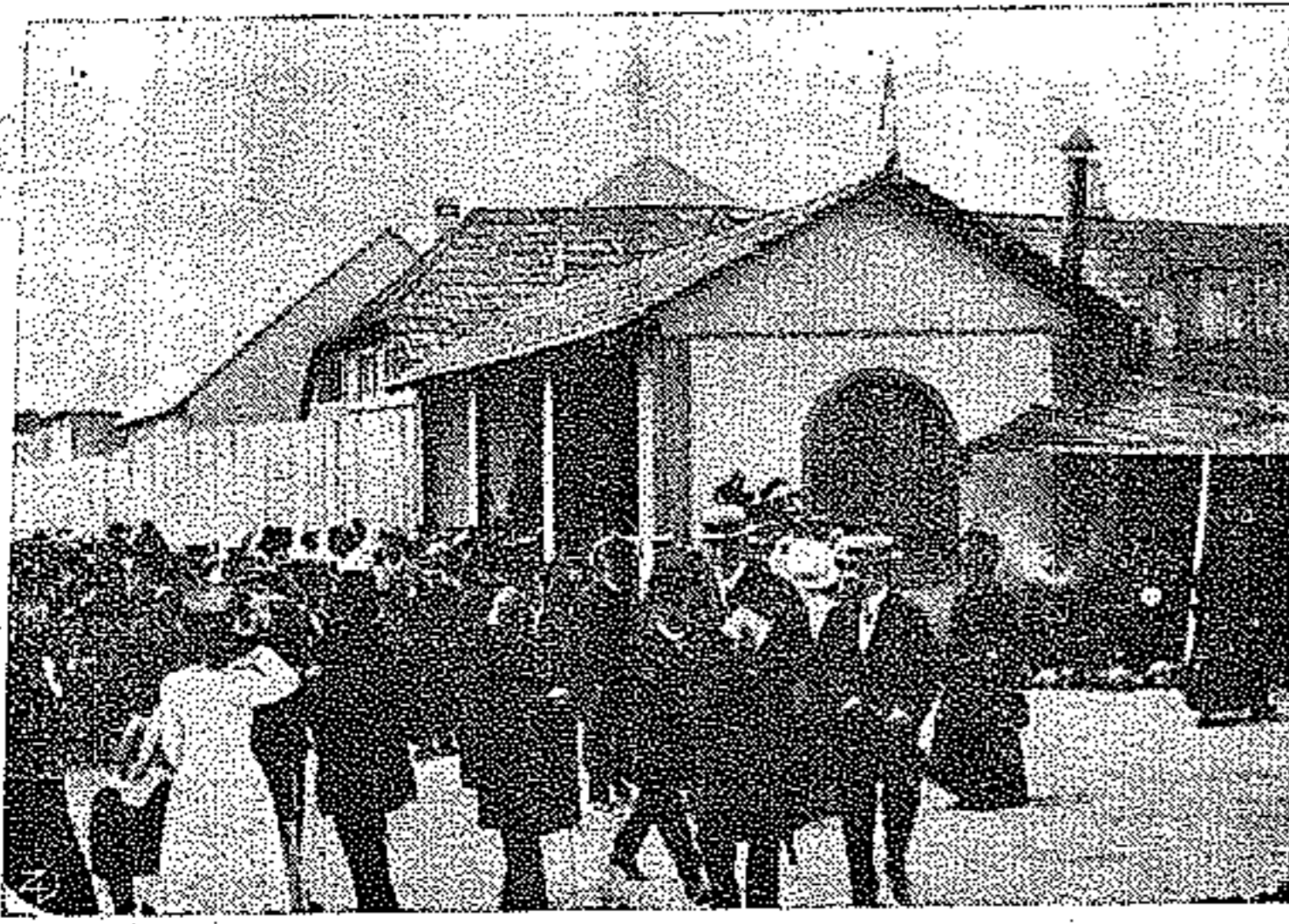
Casello moderno di caseificio in azione all'Esposizione di Asiago, nel momento in cui il sottosegretario Luciani ne esce dopo avere assistito alla fabbricazione del formaggio e del burro.