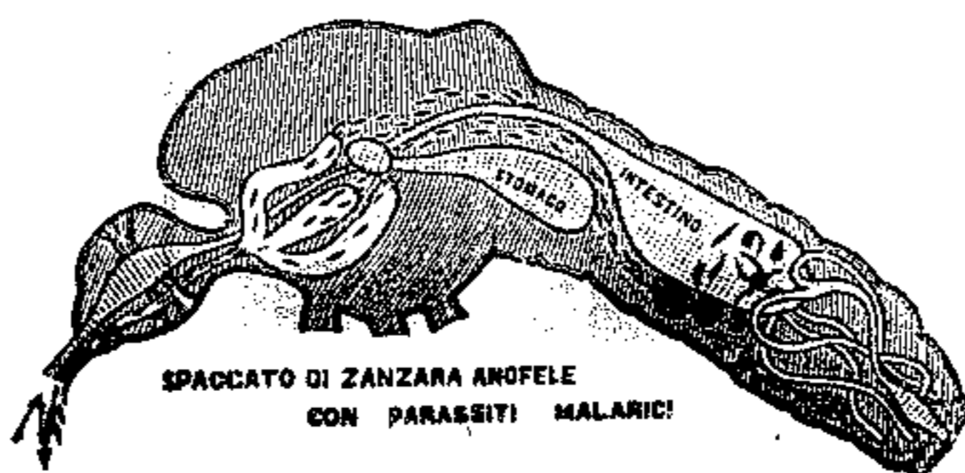
SPACCATO DI ZANZARA ANOFELE CON PARASSITI MALARICI

rimedio sicuro contro l'infezione malarica