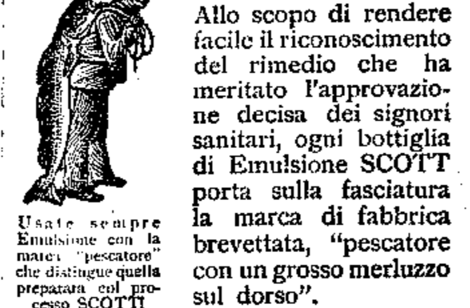
Usate sempre Emulsione con la marca "pescatore" che distingue quella preparata col processo SCOTT

Allo scopo di rendere facile il riconoscimento del rimedio che ha meritato l'approvazione decisa dei signori sanitari, ogni bottiglia di Emulsione SCOTT porta sulla fasciatura la marca di fabbrica brevettata, "pescatore con un grosso merluzzo sul dorso".