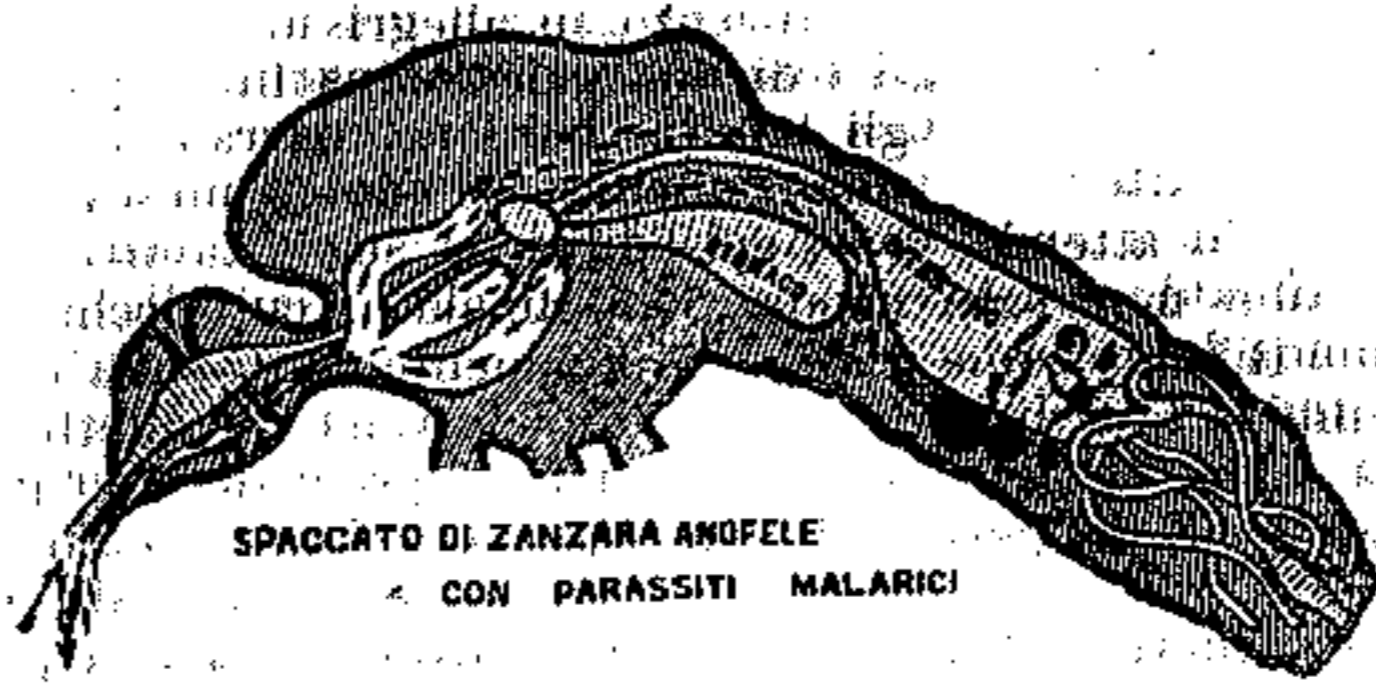
SPACCATO DI ZANZARA ANOFELE CON PARASSITI MALARICI

profilattico della malaria Formula dell'illustre Clinico Prof. GUIDO BACCELLI