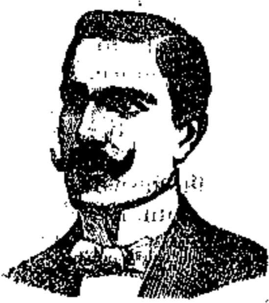
N. CASILE Riviera di Chiaia, 235 Napoli

Uomini nel genere che fanno meriti nelle Esposizioni Estere e Nazionali. Medaglia d'oro. I confetti Casile danno alla vita penitente una nuova e sana vita, evitando l'uso delle pericolosissime candele di legno, e hanno istantaneamente il loro effetto e la frequenza di arrivare gli unici che guariscono radicalmente i disturbi nervosi, Catarsi della vescica, cisti di bionda, cisti di urina, flogosi ovariche, (Gineciti) ecc. Un solo confetto Casile con la dovuta istruzione L. 2.