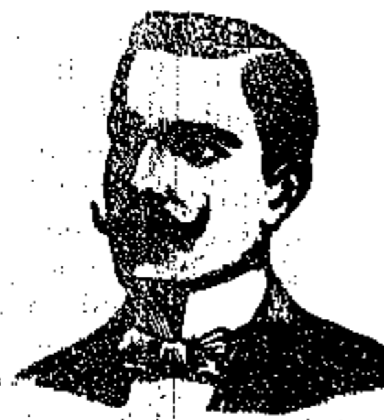
N. CASILE Riviera di Ghiata 235 NAPOLI

Gonfotti Casile danno alla via genita urinaria il suo stato normale, evitando delle pericolosissime emolite talgono, calmano istantaneamente il brucore e la frequenza urinare gli unici che guariscono radicalmente i Rostriugamenti uretrali, Prostatiti, uretriti, Catari della vescica, cistiti, incontinenza urinaria, flussi emorragici, cistite militare ecc. Una scatola di Gonfotti con la dovuta istruzione L. 330. — Il Rosi purativo Casile ottimo ricostituente antisifilitico e rinfrescante del sangue, guarisce e pietamento e radicalmente la Sifilide, Anemia, Impotenza, dolori delle ossa del nervo sciatico, macchie della pelle, perdite seminali, polluzioni, spermatorrea, erpelisano, albuminuria, serofola, linfatismo, rachitismo, infanadonna, stegitid, neurastenia ecc. Un flacone di Casile con la dovuta istruzione L. 250.