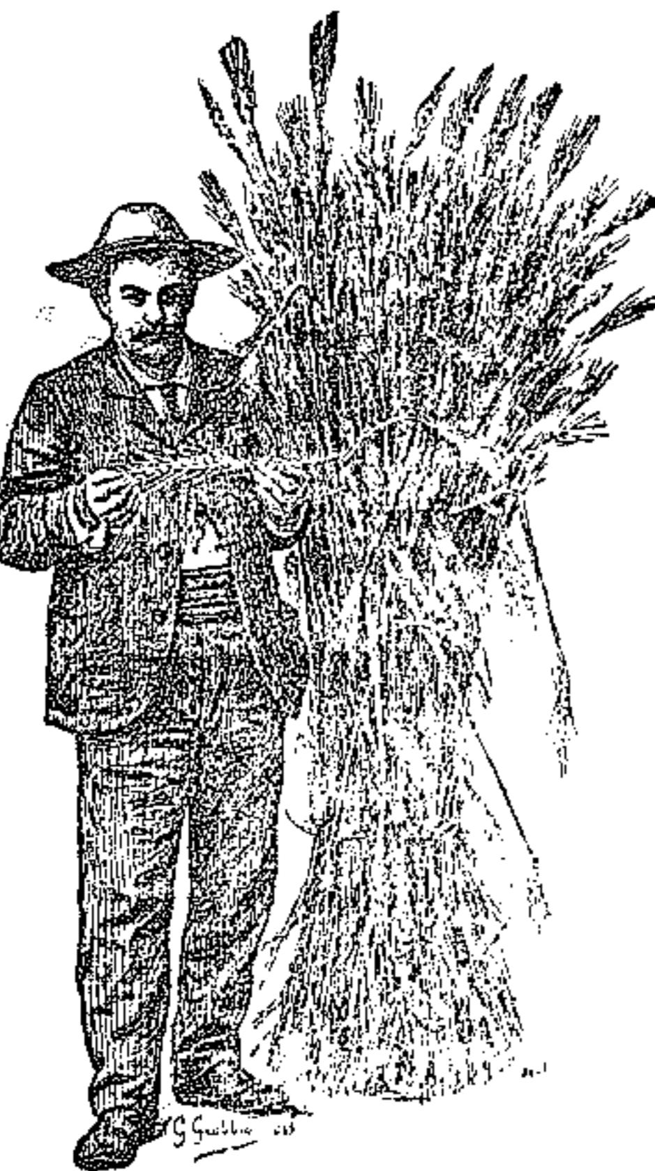
Frumento Fucense delle tenute del Fucino di proprietà del principe Torlonia

Corso Buenos Ayres, 54 - MILANO - Corso Buenos Ayres, 54