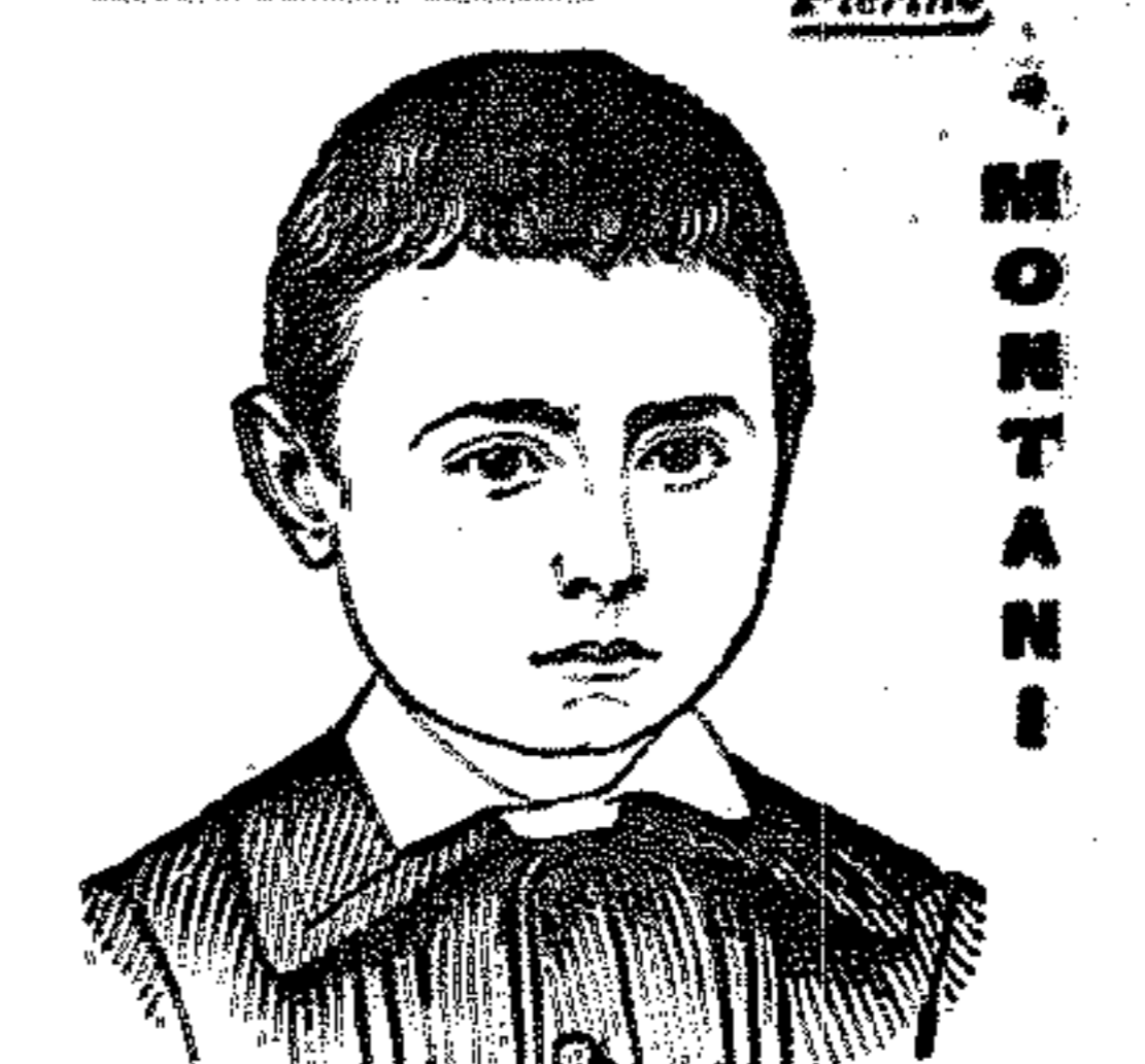
Montano (Teramo), 28 Settembre 1902.