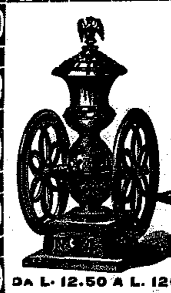
DA L. 12.50 A L. 120

Listino dei prezzi con disegni si spedisce a chiunque ne fa richiesta.