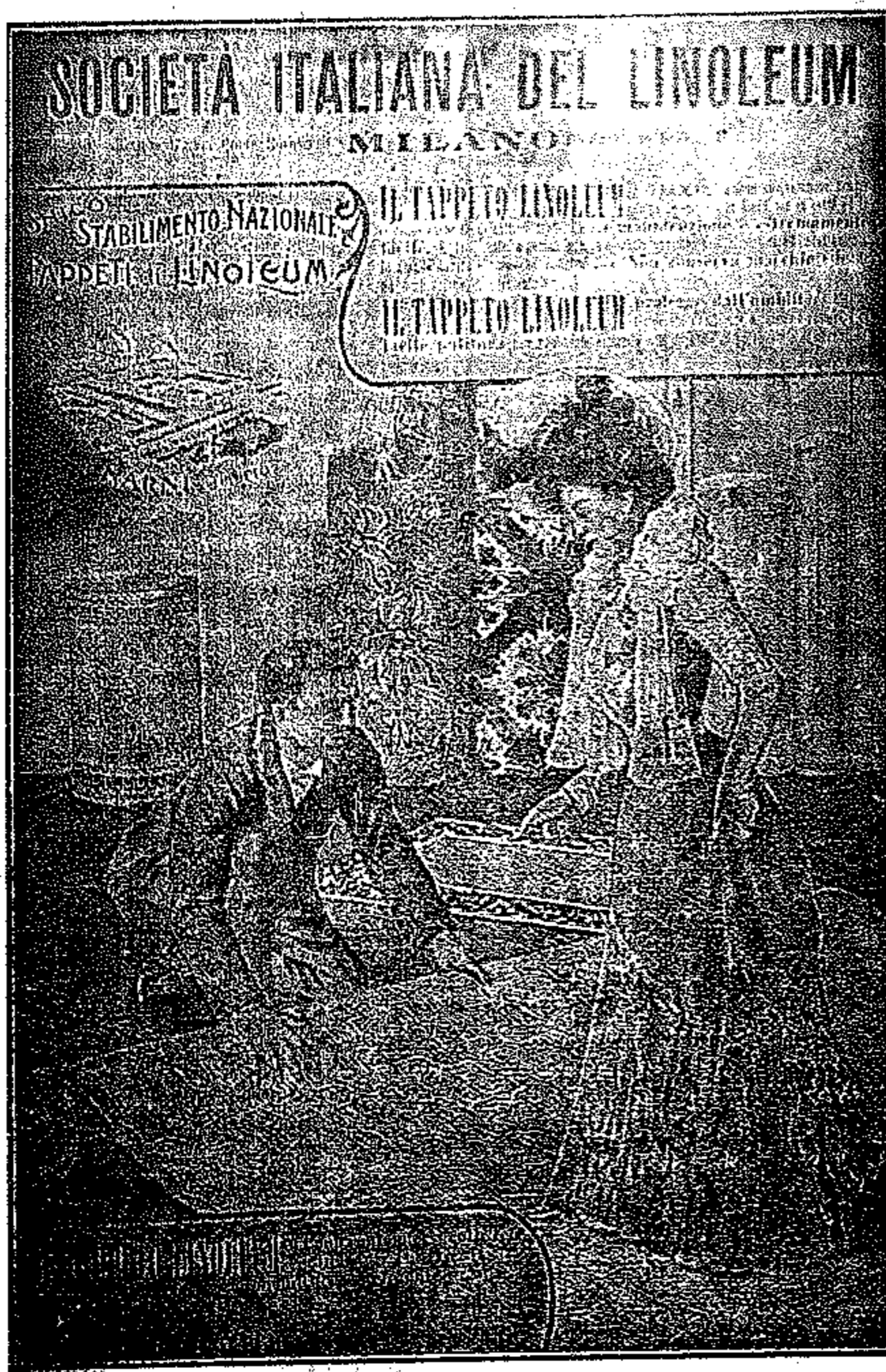
Deposito per Udine Provincia Maddalena Coccolo