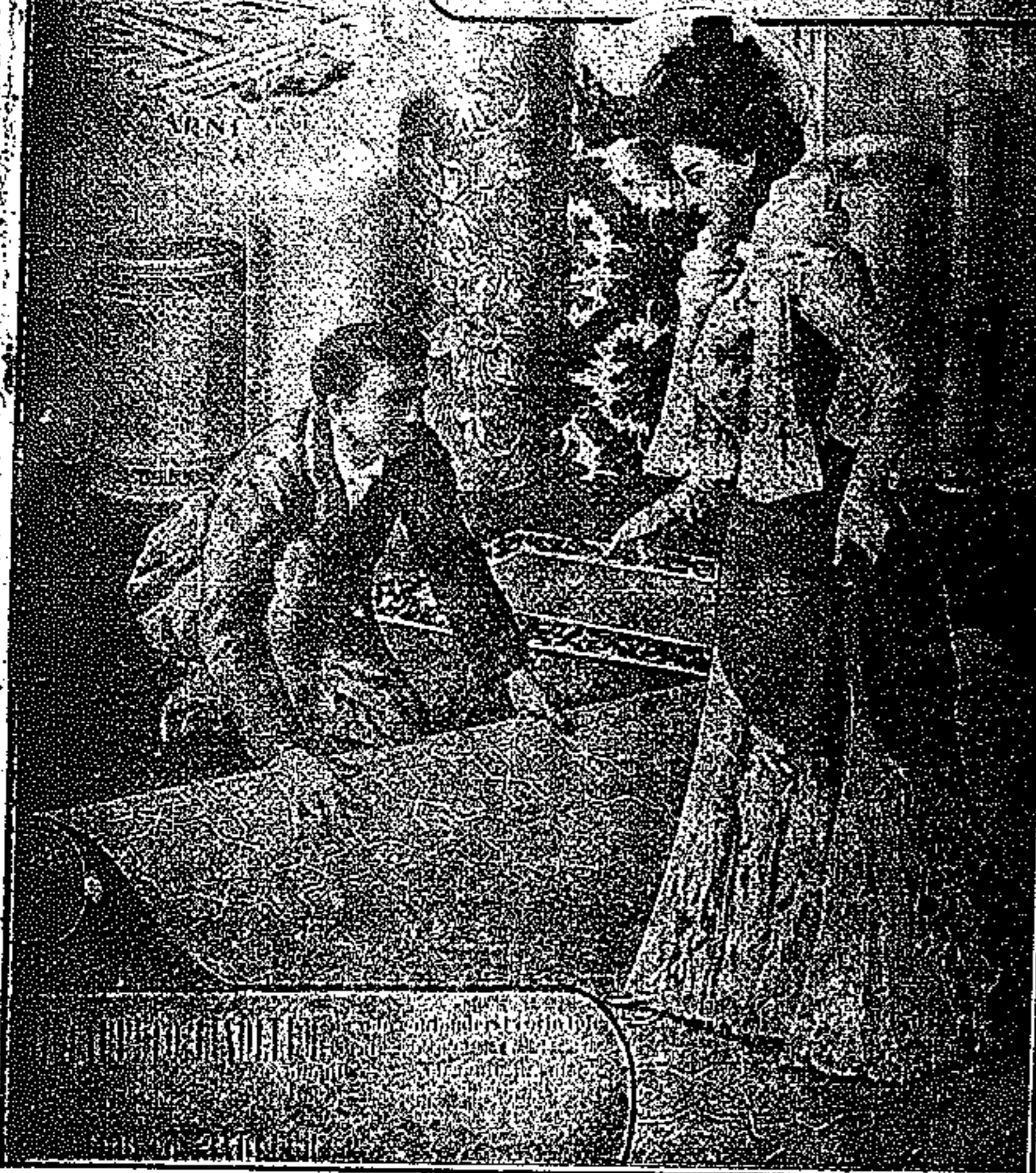
Deposito per Udine Provincia Maddalena Cocco

STABILIMENTO NAZIONALE TAPPETI LINOLEUM TAPPETI LINOLEUM TAPPETI LINOLEUM