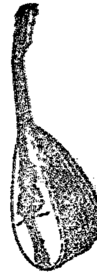
Da L. 10.00 in più

Negozi - Laboratorio - Magazzino d'istrumenti e musica d'ogni qualità