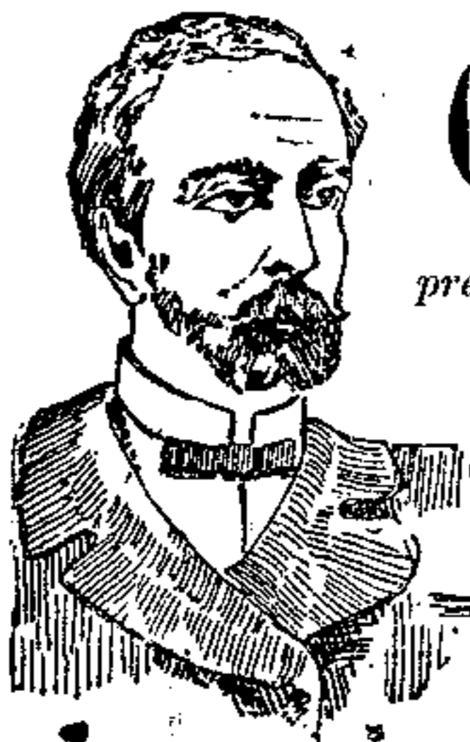
PRIMA DELLA CURA

Alle spedizioni per pacco postale aggiungere cent. 80