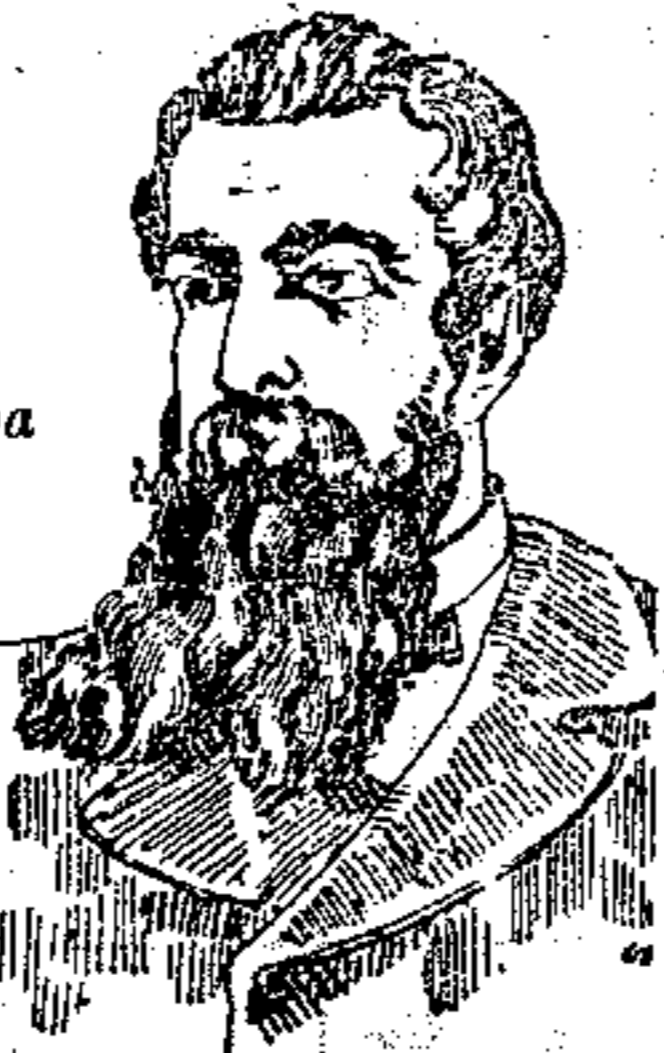
DOPO LA CURA