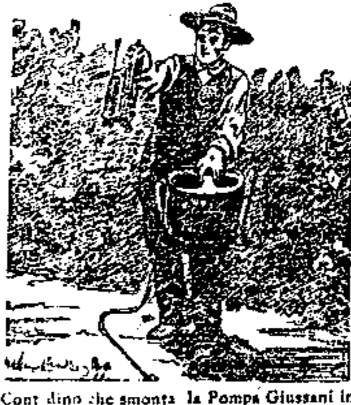
Cont. d'ogni che smonta la Pompa Giussani in canti, già senza stato di caccia od altro.

Completa compresa le cinghie, tubo di gomma e getto "TRIPLEX", a 3 sistemi LIRE 25 LIRE (e per L. - 27.50 franco in qualsiasi Stazione d'Italia)