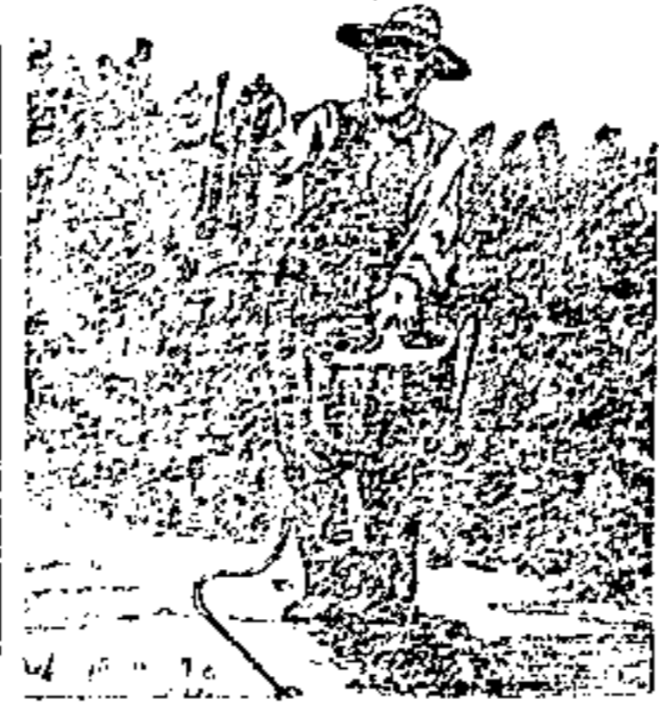
Una pompa che somministra la Pompa Giussani in ogni caso di acqua potabile ed altro.

(e per L. 27,50 franco in qualsiasi stanza d'Italia)