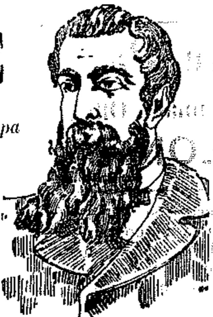
DOPO LA CURA

Per le inserzioni in terza ed in quarta pagina pagare il prezzo anticipato.