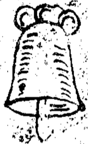
Fac-simile d'un contorno di campana mal fatto sulla coperta dal Durighino.

In quest'anno (1624) si fece rifondere la campana maggiore a Cividale: