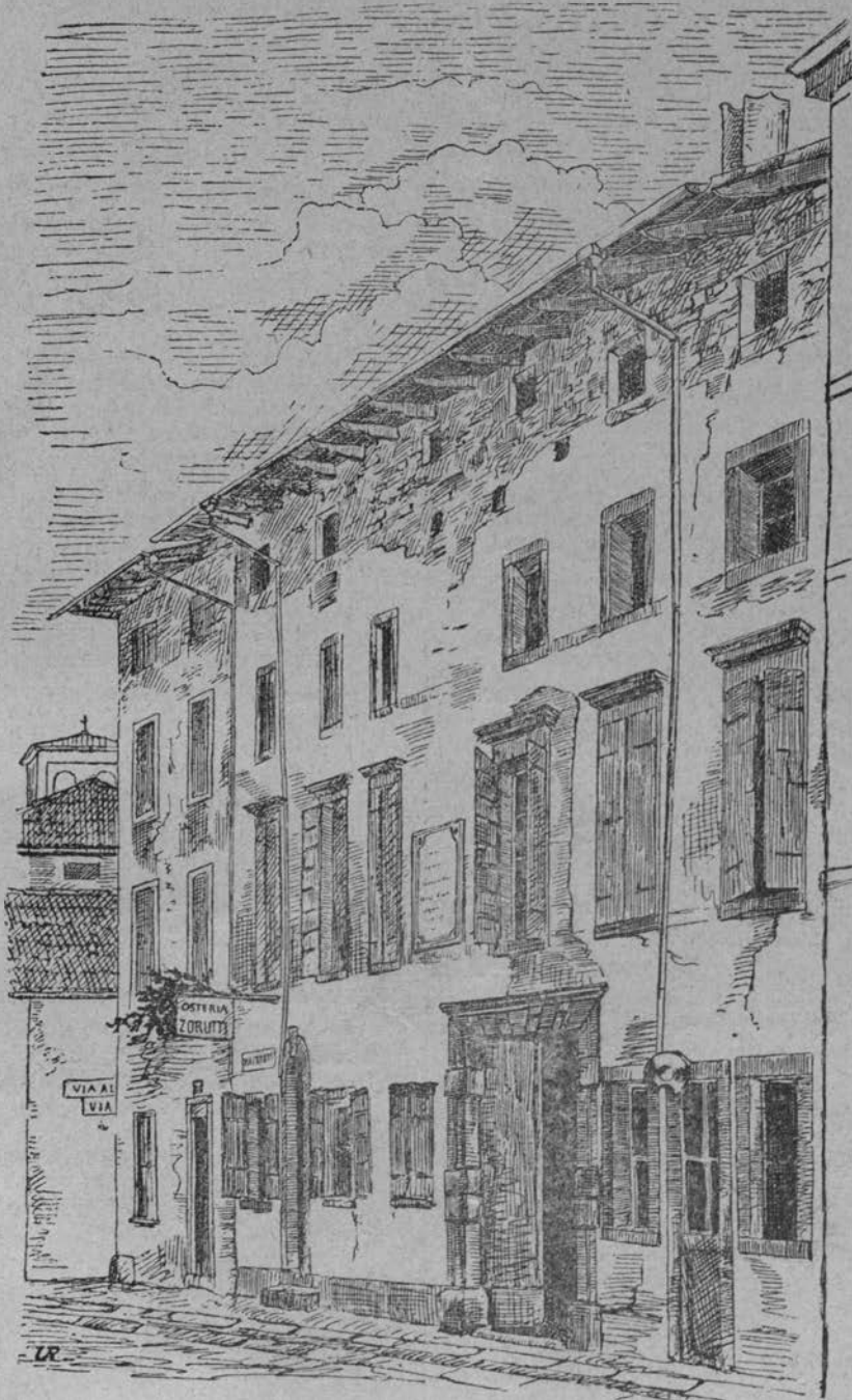
Casa che fu della famiglia Zorutti, in Cividale.