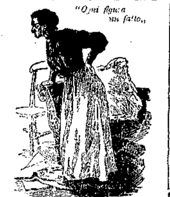
Come si conosce un'affezione renale?