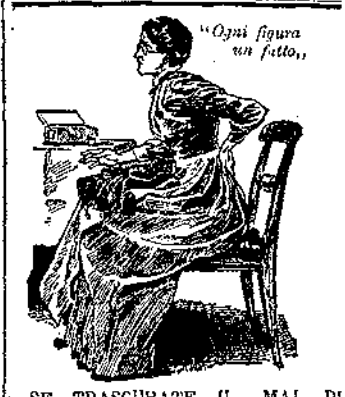
« Ogni figura un fatto, »