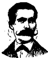
A. Salvati Costanzi Inventore

sono lo SPECIALITÀ COSTANZI usate per guarire completamente le malattie genito-urinarie, le sole premiate con medaglia di argento alla Grande Esp. Naz. d'igiene di Napoli, 1900.