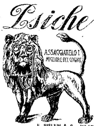
F. BISLERI & C. - MILANO

Il vero Unguento Foster trovasi in vendita anche presso tutti i farmacisti a L. 350 la scatola, o 6 scatole per 19 o franco per posta, indirizzando le richieste, col relativo importo, alla Ditta C. Giongo, Specialità Foster, 19, Via Cappuccio, Milano. Nell'interesse della vostra salute esigete la vera scatola, e rifiutate qualunque imitazione o contraffazione.