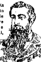
DOPO LA CURA

L'ACQUA CHININA-MIGONE, preparata con statura speciale e con mistero di primissima qualità, possiede le migliori virtù terapeutiche, le quali sul auto sono un possente e tenace rigeneratore del sistema capillare. Essa è un liquido rinfrescante e limpido ed interamente composto di sostanze vegetali, non cambia il colore dei capelli e ne impedisce la caduta prematura. Essa ha dato risultati immediati e soddisfacentissimi anche quando la caduta giornaliera dei capelli era fortissima.