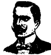
CASILE RIVIERA di CHIATA 235 Napoli

I CONFETTI CASILE danno alla via geniturinaria il suo stato normale, evitando l'uso della pericolosissima candolete, tolgono, calmano istantaneamente il bruciori e la frequenza di urinare, gli urini che guariscono radicalmente I RESTRINGIMENTI URINARI, Prostatiti, Uretriti, Catarri della vescica, calcoli, incontinenza d'urina,flussi blenorragici (gocce) (malattie) ecc. Una scatola di Confetti con la dovuta istruzione L. 3.50. Il IORUBIN CASILE ottimo ricostituente antilitico e rinfrescante del sangue guarisce completamente e radicalmente la Sifilide, Anemia, Impotenza, dolori dello stomaco, del nervo sciatico, adeniti, macchie della pelle, perdite seminali, polmoniti, spermatorrea, epistassi, alariti, usura-stenia contro l'acido urico ecc. ecc. Un flacone di IORUBIN CASILE con la dovuta istruzione L. 3.