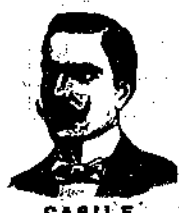
CASILE RIVIERA DI CHIARA 286 Napoli

I CONFETTI CASILE danno alla via genitoria il suo stato normale, evitando l'uso delle pericolosissime candlette, tolgono, e hanno istantaneamente il bruciore e la frequenza di urinare, gli urti che guariscono radicalmente I RESTRINGIMENTI URETRALI, Prostatiti, Uretriti, Gattari della vescica, calcoli, incontinenza d'urina, flussi emorragici (gocce militari) ecc. Una scatola di Confetti con la dovuta istruzione. L. 3.50.