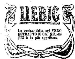
La cucina fatta col VERO ESTRATTO DI CARNE LIEBIG è la più appetitosa.