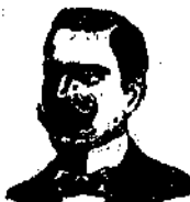
CASILE RIVIERA di CHIARA 236 Napoli

Non più SIFILIDE mediante il mondiale IORUBIN CASILE RESTRINGIMENTI URETRALI Prostatiti, Uretriti e Catarri della Vesicola si guariscono radicalmente con i rimedi CONFETTI CASILE