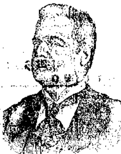
Marca di Fabbrica Depositata

Si vende presso l'Amministrazione del giornale "Il Paese" a lire 3 alla bottiglietta grande formata e presso il parrucchiere A. Gervasutti in Mercatorvecchio.