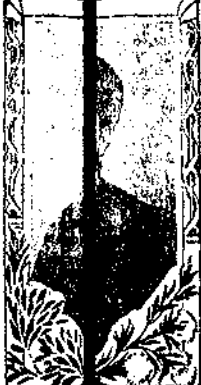
Signora Oreste (S. Maria)