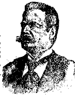
(Marchio di Fabbrica Depositato)

Questa importante preparazione, senza essere una tintura, possiede la facoltà di ridonare mirabilmente ai capelli e alla barba il primitivo e naturale colore brondo, castano, nero e rosso, bellezza e vitalità come nei primi anni della giovinezza. Non macchia la pelle, né la biancheria; impedisce la caduta dei capelli, ne favorisce lo sviluppo, pulisce il capo dalla forfora.