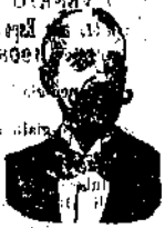
A. Salvati-Costanzi Inventore

poi medicinali Salvati-Costanzi, ritenuti una vera panacea per tutti i mali gonito-urinarli. E difatti, basta consultare l'interessantissimo opuscolo tascabile che si spedisce gratis dietro richiesta, per rimanere sbalorditi nell'apprendere come coll'uso di semplici confetti che hanno la virtù di distruggere le calcolosità che si formano nell'uretra, ciò che impe-