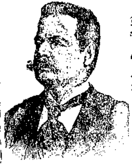
(Marca di Fabbrica Depositata)

Sui libri di testo sconto del 15 per cento sui prezzi stampati sulle copertine.