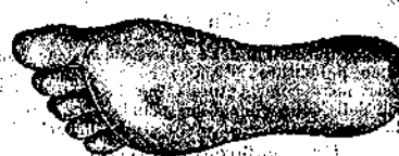
Aspetto del piede coll'uso delle suole d'asbesto

Questa suola ha la superficie ruvida e perciò il piede, posando sopra sicuro, non scivola né di una parte né dall'altra. Evitando tale inconveniente, e grazie alla sua morbidezza ed elasticità, si rende la camminare molto comodo e si acquista una maggior forza nel movimento senza stancarsi. Di più i vari malanni dei piedi vengono totalmente eliminati. - Vendesi a L. 2.00, 1.00 ed a cent. 60 al paio.