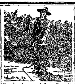
Contiene che monta la Pompa Giussani in campagna senza aiuto di nessuno od altro

(e per L. 27,50 franca in qualsiasi Stazione d'Italia)