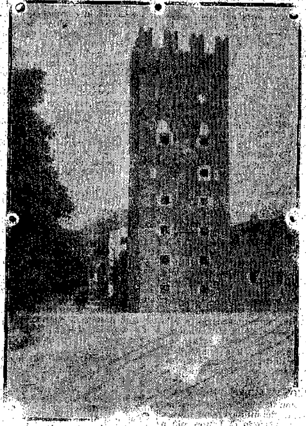
TRENTO, Torre Vanga.

3 Gennaio In valle Lagarina nella giornata del 24 il nemico ripropose un tenta-