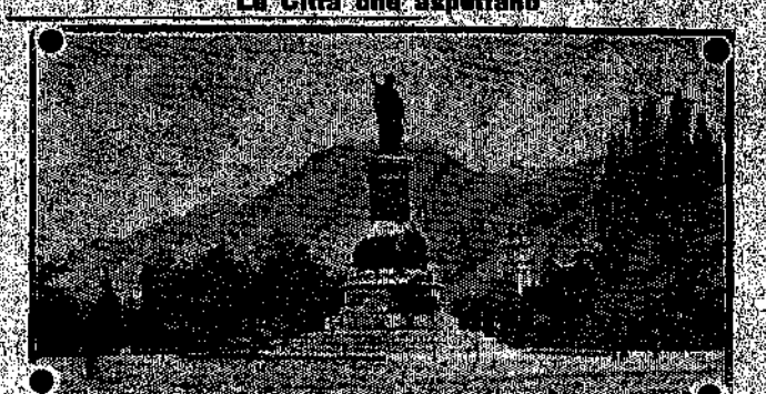
TRENTO - Il monumento a Dante