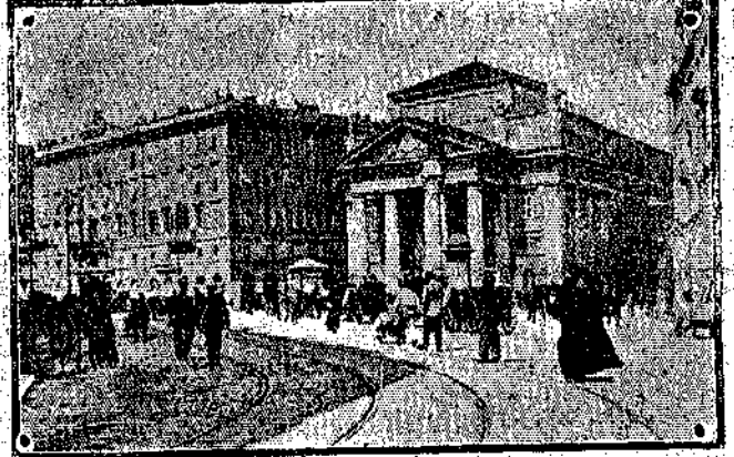
TRIESTE - Piazza della Borsa

21 ottobre. In complesso vi vennero fatti 1184 soldati e 25 ufficiali prigionieri. 22 ottobre. Le nostre truppe debbono lottare a superare difficoltà del terreno e di difese nemiche, lotta lenta per se stessa e non sempre di facile attuazione: tuttavia, nei giorni 21 e 22 notevoli progressi vennero fatti sull'altipiano, specialmente verso San Martino del Carso, cioè al centro del nostro fronte di battaglia dinanzi al campo trincerato di Gorizia. Altri progressi sensibili vennero conseguiti sulle colline di Oslavia, località che difende Gorizia dalla destra dell'Isonzo, a sud del Monte Sabotino e di San Floriano. Anche le operazioni per la conquista del campo trincerato di Tolmino presentano le stesse difficoltà ma anche su questo settore vennero fatti nuovi progressi, tanto sulla sinistra, quanto sulla destra dell'Isonzo. Risulta infatti dal comunicato ufficiale che le nostre truppe progredirono nella zona del Monte Nero, sul piccolo Invorcek, sulla collina di Santa Lucia, ove anche nella precedente azione vennero conquistate ben munite trincee, e ad est di Flavva, tutte località di difficilissimo approccio, sia per gli ostacoli natura-