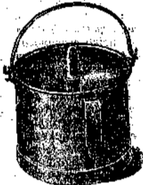
POPPATOIO per allattamento artif.