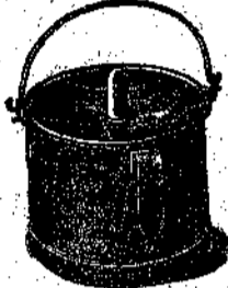
POPPATOIO per allattamento artif.

Catena con gancio di salvamento per bovini