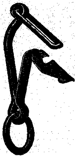
Gancio di salvamento

Il GANCO DI SALVAMENTO trova il suo più importante impiego in casi di incendio nei quali torna impossibile sciogliere il bestiame dalla greppia sia per l'urgenza del momento, sia per gli sforzi che esso fa per liberarsi da sé; nei casi in cui