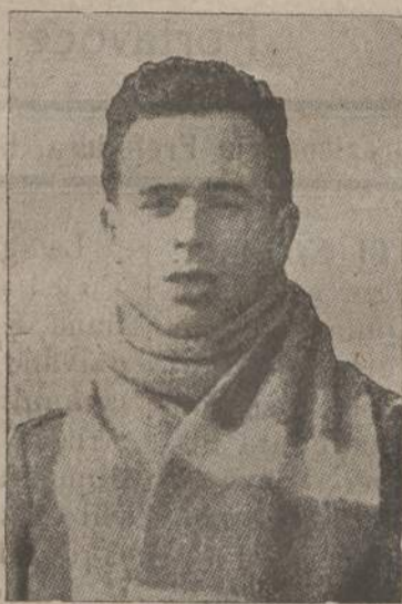
Broili Francesco di Francesco di Udine

nato a Latisana dimorante a Udine. Figlio dell'armi conseguì la carriera militare. La nostra guerra lo ebbe capitano. Audace, coraggioso temerario, prese parte a tutti i combattimenti dal primo giorno della entrata in campagna. Ferito più volte avrebbe potuto risparmiare la vita, ma la voleva consacrata al dovere: e da vero eroe cadde con il petto squarciato il 22 ottobre 1915, a Monfalcone. Venne decorato con la medaglia d'oro, la massima onorificenza che toccò ai friulani. Lascia due teneri figli e la moglie