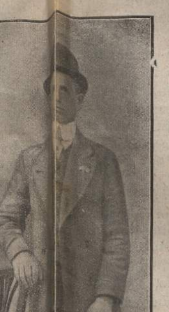
di Cavasso Nuovo. Alpino ardimentoso ... Trentino lasciava la vita ... da pr...