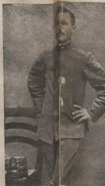
Soravito Domenico di Socch Nella patria di Pietro Calvi, soldato del... Regg. Fanteria da riva il...