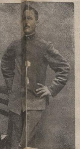
Atto Domenico di Socchieve Alpino di Pietro Calvi, in Cadore, ... Regg. Fanteria da prode mo-