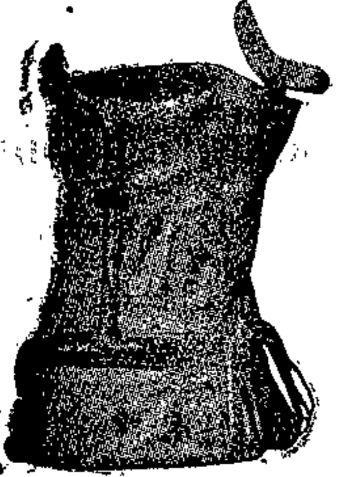
Corsetto per scoliosi (tipo Hessing modificato).

Tel. 298 Piazza del Duomo - UDINE - Piazza del Duomo Tel. 298 di lato al Gabinetto dentistico dott. L. Spellanzon