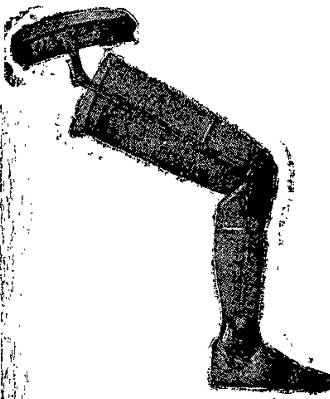
Gamba artificiale con articolazione in corrispondenza del ginocchio e del piede