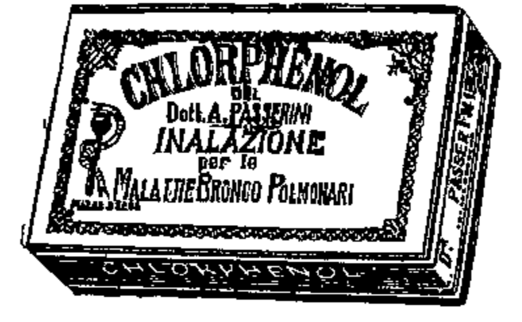
CHLORPHENOL per Inhalazione per le Malattie del Circolatorio Polmonari.

Cure moderne, razionali, a base di Terapia Fisica e, quindi, di efficacia assoluta nell'Istituto Aero-Elettroterapico di Torino, unico in Europa, fondato (nel 1892) e diretto dallo Specialista dott. L. GUIDO SCARPA, Direttore della Sezione «Malattie di Petto» nel Policlinico Generale. Guarigione dell'Enfisema Polmonare e dell'Asma, dei postumi di Influenza; guarigione della Tuberculosis Polmonare in 1° stadio e delle Pleuriti con un nuovo metodo proprio fisiomeccanico brevettato che permette agli infermi di curarsi a casa propria rimanendo sotto la sorveglianza del proprio medico. Risultati ottimi, non raggiungibili con qualunque altra cura, anche nelle tuberculosis avanzate e nella stessa vera tisi polmonare come pure in tutte le Malattie dell'Apparato Circolatorio (Vizi valvolari, Arteriosclerosi, Aneurismi, Nevrosi del cuore, ecc.). Consultazioni tutti i giorni dalle 15 alle 17. Giovedì e Domenica, dalle 17 alle 19. Consultazioni a tariffa ridotta per i signori Maestri, Maestre, Sottufficiali, piccoli Esorcisti, Operai e loro famiglie, cui si concedono le cure a tariffa ridottissima, cioè contro rimborso dei soli 3/5 delle spese vive di costo. Chiedere opuscoli e schiarimenti che si inviano gratis.