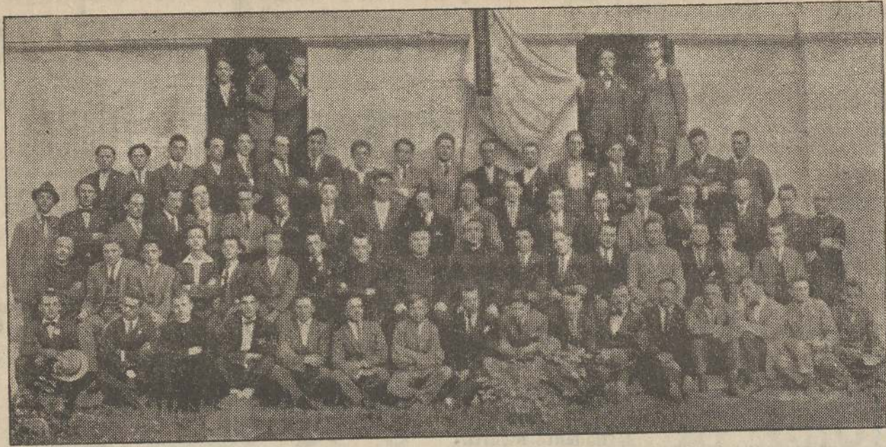
GRUPPO DEI PARTECIPANTI AGLI ESERCIZI SPIRITUALI IN SEMINARIO