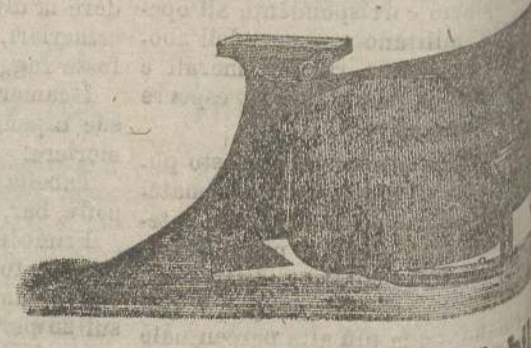
ARATRO ad ali regolabili

Per acquisti e riparazioni rivolgersi alla