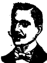
N. CASILE Riviera di Chiata 285 NAPOLI

I Confetti Casile danno alla via genito-urinaria il suo stato normale, evitando l'uso delle pericolosissime caudolette volgare, calmano istantaneamente il bruciore o la frequenza di urinare, gli unici che guariscono radicalmente i Restringimenti uretrali, Prostatiti, Uretriti, Cistiti, Catarrhi della vescica, autocoli, incontinenza d'urina, flussi benorragici, (gocchia militare) ecc. Una scatola di Confetti con in dovuta istruzione lire 3.00 - Il Koob depurativo Casile ottimo ricostituente antisifilitico e rinfrescante del sangue, guarisce completamente e radicalmente la Sifilide, Anemia, Impotenza, dolori delle ossa, del nervo sciatico, adeniti, macchie della pelle, perdite seminali, pollicioni, spermatorrea, erpetismo, albuminuria, scrofola, infatiamo, rachitismo, linfadenoma, sterilità, neurastenia, ecc. Un flacone di Koob Casile con la dovuta istruzione L. 2,50.