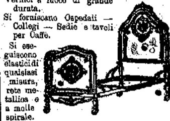
Prezzi da non temere concorrenza